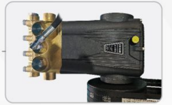
پمپ برند اروپایی