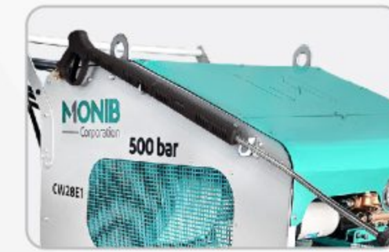
گان و لنس