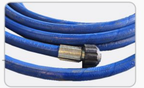
شیلنگ فشار قوی ۱۰ متری