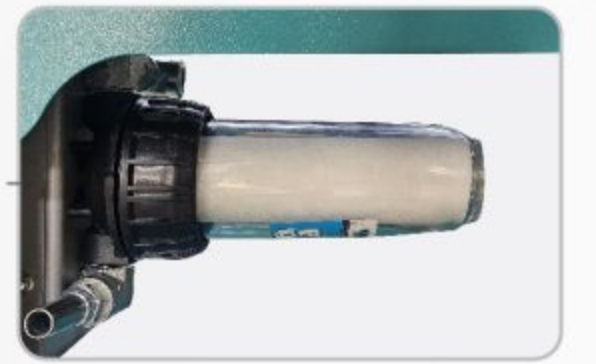
فیلتر آب ورودی