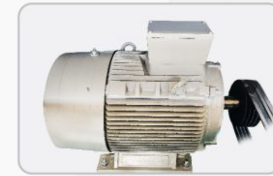
موتور الکتریکی الکتروژن