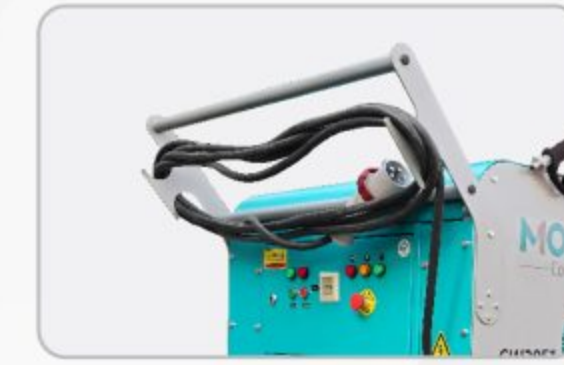
کابل سه فاز ۱۰ متری