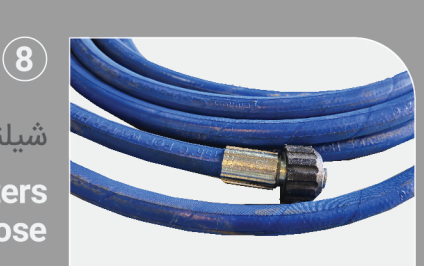
شیلنگ فشار قوی ۱۰ متری 10 Meters High Pressure Hose