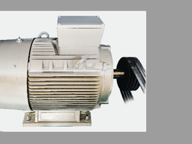
موتور الكتريكي الكتروژن Electrogen Electric Motor