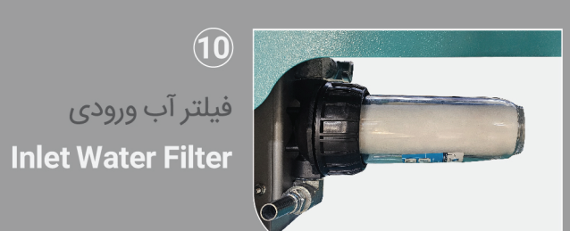
Introduction of Product Components