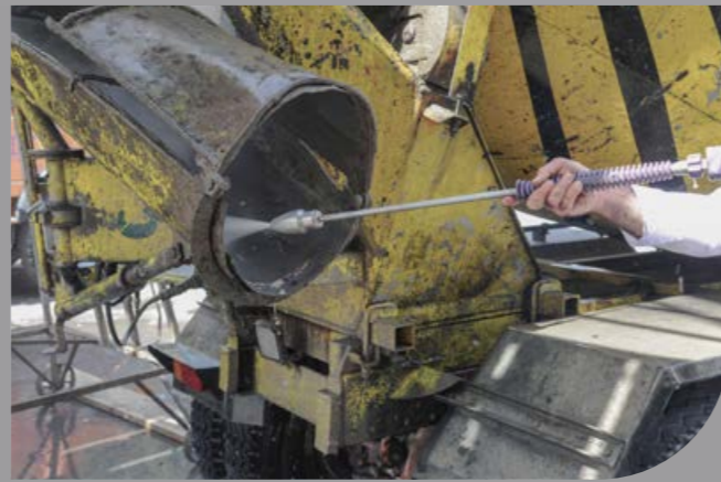
2 پمپ برند اروپایی European Pump